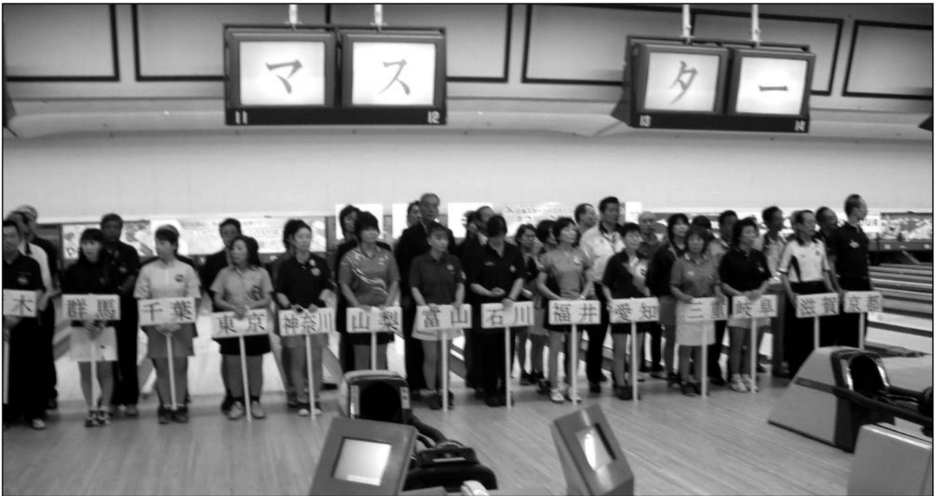
■マスターズボウリング大会の選手たち