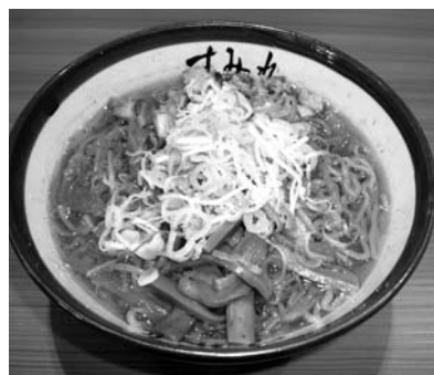
■札幌「すみれ」のみそラーメン