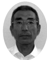
ヒダ株式会社 営業本部長 執行役員