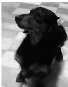
モバイル 谷迫いずみ 愛犬 てんてん