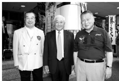
■赤木恭平 全日本ボウリング協会会長、肥田社長、森喜朗 日本体育協会会長