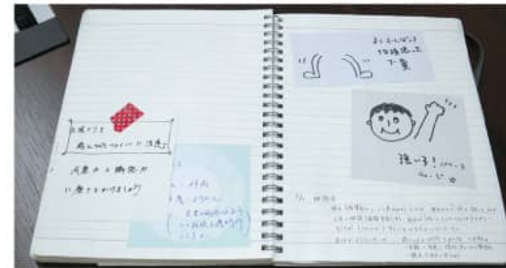
当時の先輩から買ったメモや付箋は、今でも大事に保管している

仕事に慣れたと思っていた時期でのことだったのでショックが大きかった。しかし、誰も彼女のミスを責めることは無く、それどころか気を付けた方がいいポイントなどを昼休みや定時後に時間を作って話してくれた人もいたという。そんな人たちと一緒に仕事ができていることに感動と安心感をもった。また、直接声をかけなくても、付箋にアドバイスや励ましの言葉をくれた人もいて、そんな些細な行動に救われたという。