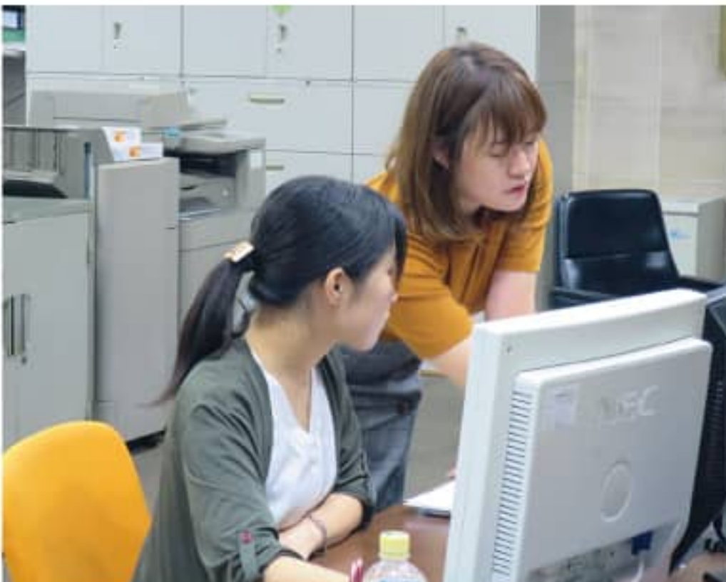
経理グループの後輩へ指導中

そう話してくれた彼女は、現在管理本部経理グループのメンバーとして働いている。毎日の経理業務に加え、上司のサポートや後輩への指導等、仕事の幅は多岐にわたる。2013年に新入社員として入社し、この係長へと昇格した。