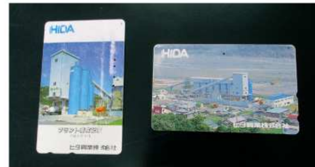
「財布に大切にしまっておいたテレホンカード」

平成10年に梅ヶ島工場へ工場長として異動。当時は砂防ダムや橋梁の建設が相次ぎ、今よりも遥かに忙しかったという。「多いときは、月に5,000m3出荷したこともあった」と振り返った。梅ヶ島からの帰り道、同僚二人で帰ってくる途中、道路から6m転落したこともあった。カローラ(車)はボンコツになったが、ケガはしなかったという。帰り道、土砂降りの雨で山道が通行止めになり、車を捨てて歩いて帰ってきたこともあったそうだ。