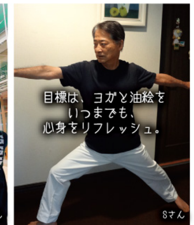
目標は、ヨガと油絵をいつまでも、心身をリフレッシュ。