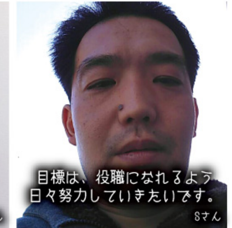
目標は、役職になれるよう日々努力していきたいです。