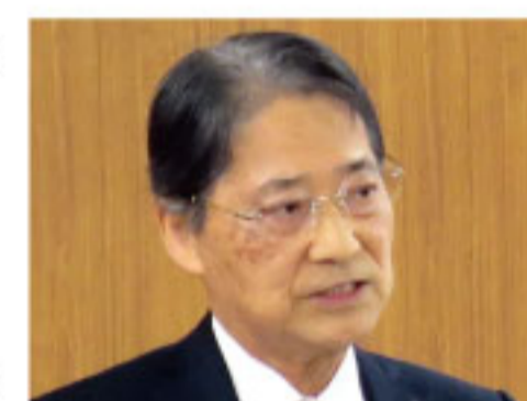
監査役(兼)内部監査室長

ES(従業員満足)を高めることを目標とする。責任をもって仕事をし、会社がどのような方向に進んでいくのかを皆で共有し、結果を共感し合う。それが結果的に取引先からのオーダーに繋がるのである。