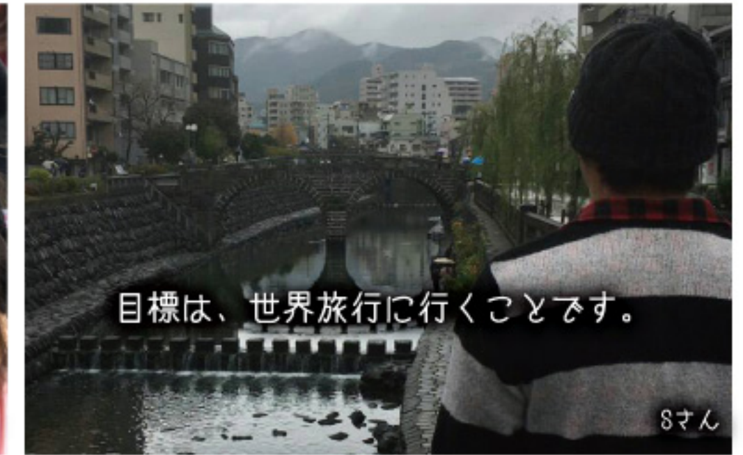
目標は、世界旅行に行くことです。