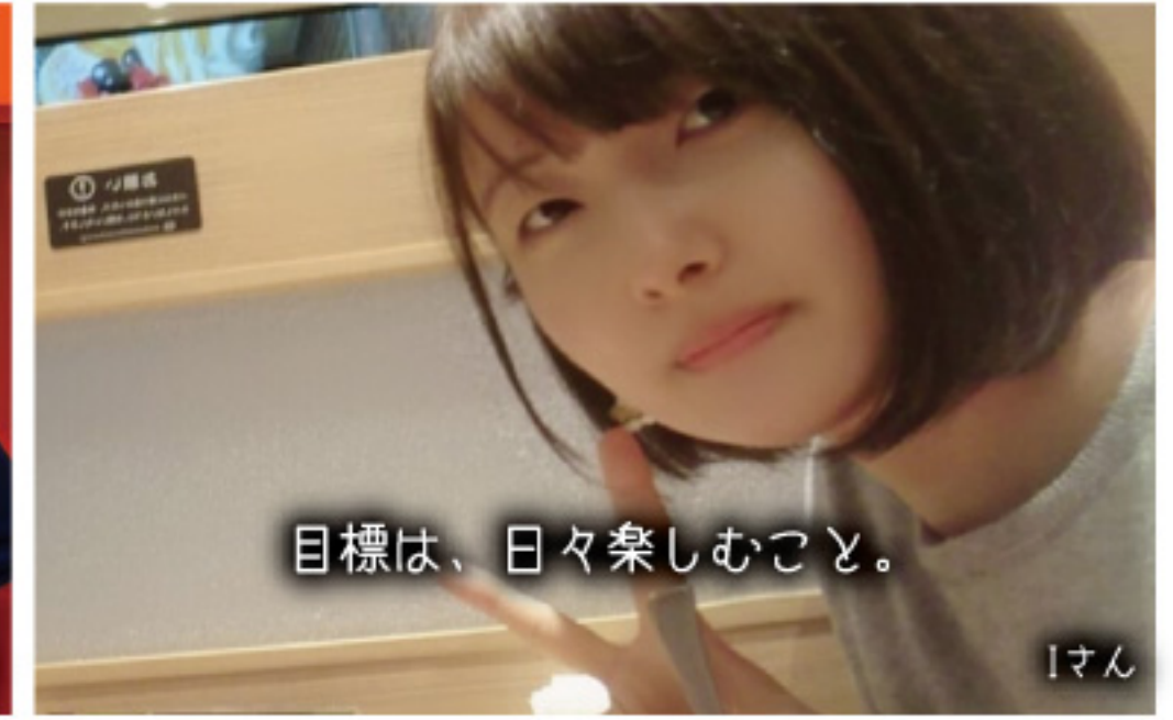
目標は、日々楽しむこと。