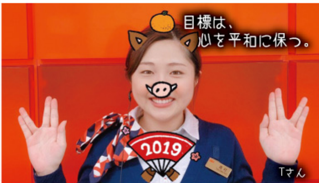
目標は、心を平和に保つ。