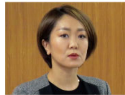
モバイル通信部長

安全作業と施工品質に加え、大型案件等での労働力不足を解消すべく、人材確保・人材育成に力を入れる。