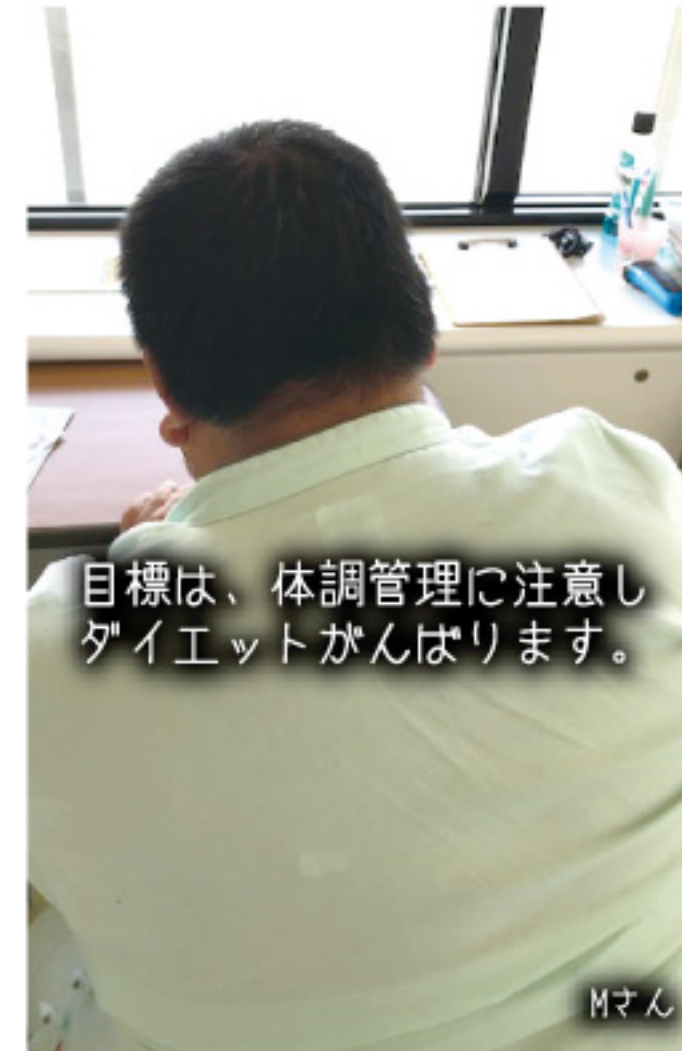
目標は、体調管理に注意しダイエットがんばります。