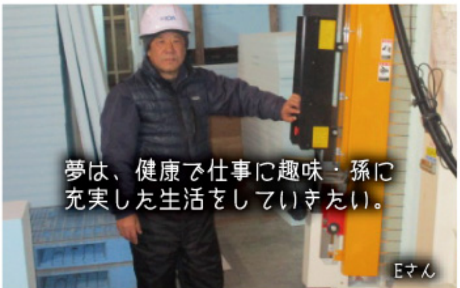
夢は、健康で仕事に興味・孫に充実した生活をしていきたい。