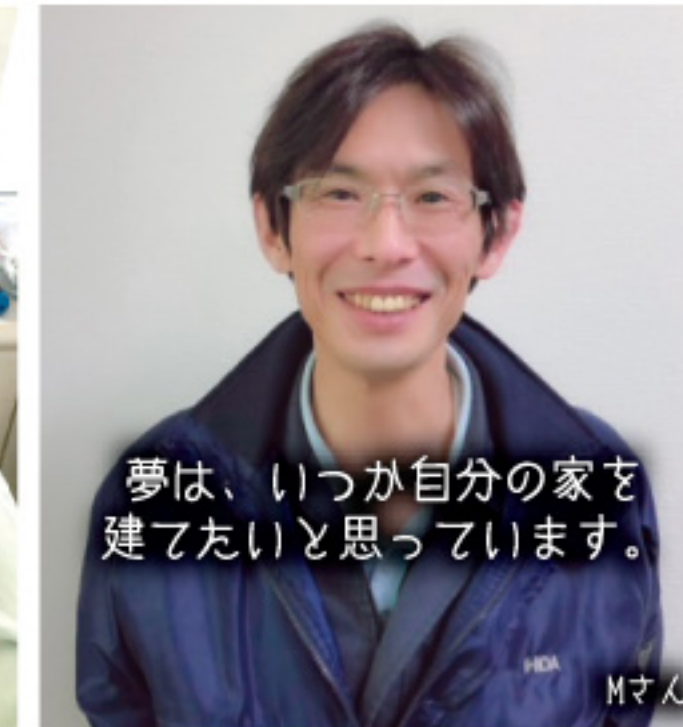
夢は、いつか自分の家を建てたいと思っています。