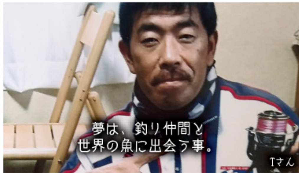
夢は、釣り仲間と世界の魚に出会う事。