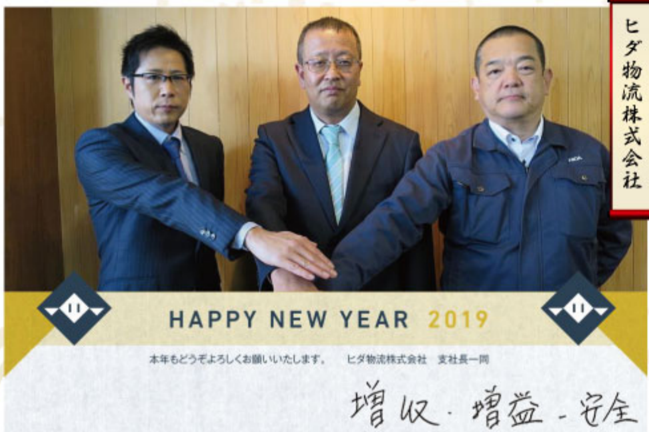
ヒダ物流株式会社