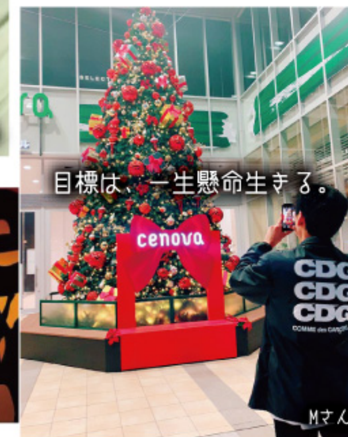
目標は、一生懸命生きる。