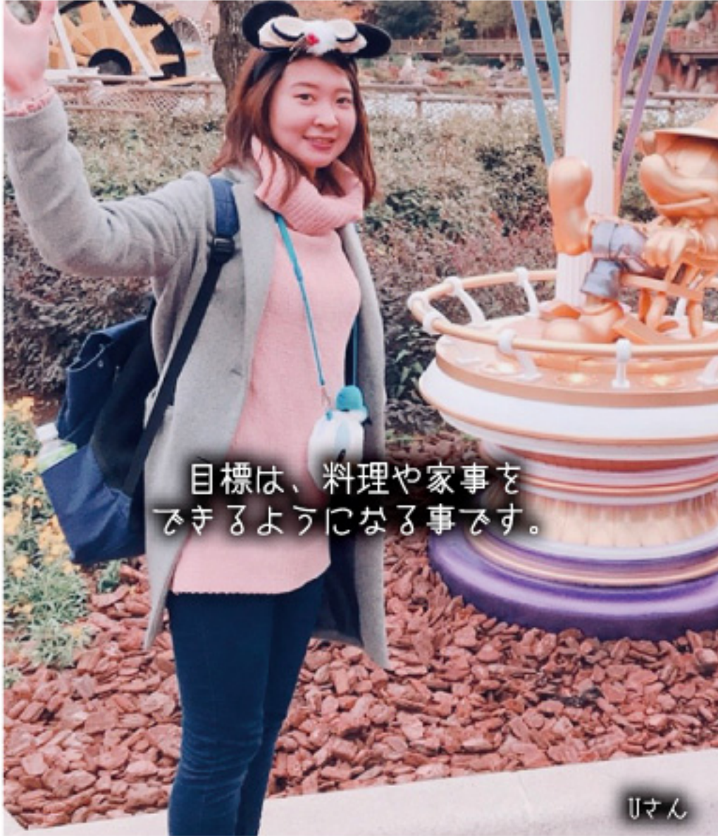
目標は、料理や家事をできるようにする事です。