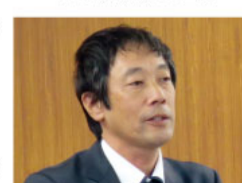
ライフライン部長

業計画目標達成、多品目化、人材育成の3点を進める。成果を出すべく猪突猛進していきたい。