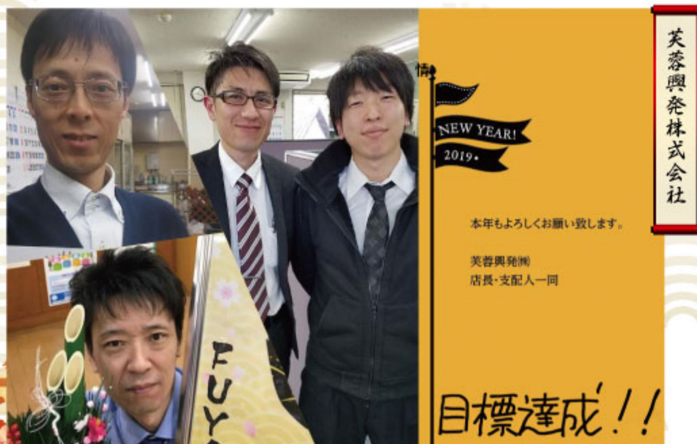
美尊興産株式会社