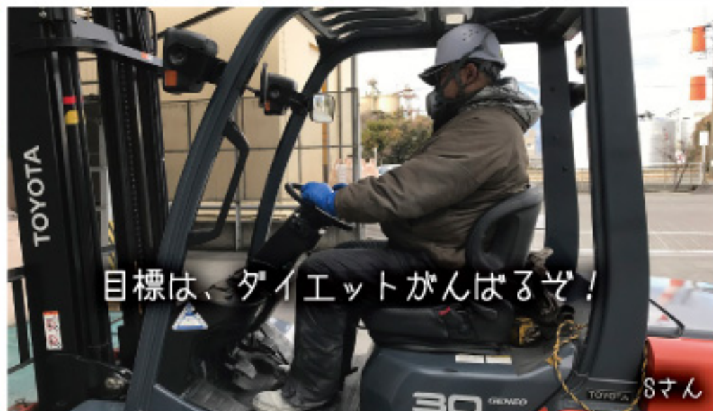
目標は、ダイエットがんばるぞ!