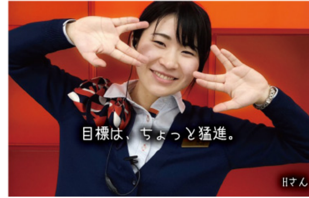
目標は、ちょっと猛進。