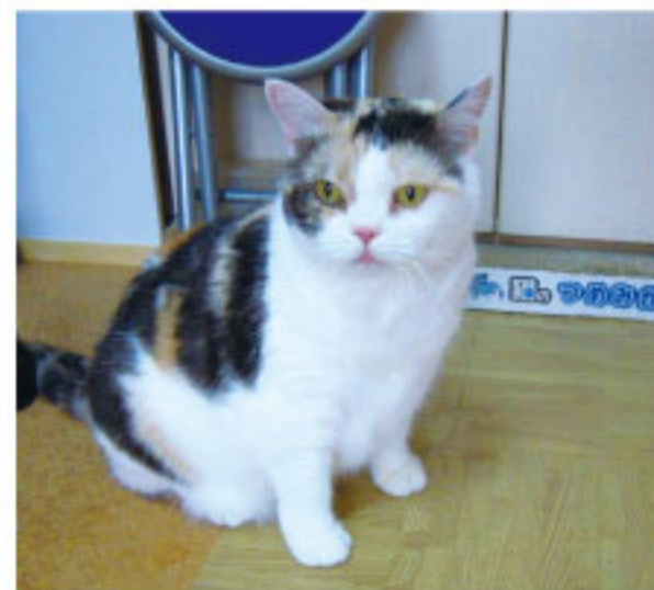
芙蓉興発株FUYO草雑店 Hさん

我が家では3匹の猫を飼っています。その中で今回は、三毛猫のミューを紹介させていただきます。歳は13才で、メスのスコティッシュ。愛嬌のある丸い顔が特徴です。大好物はチュールとネズミのおもちゃ!最近ではヒーターの前からどきません!ペットは飼い主に似ると言いますが誰に似たんでしょう?...笑