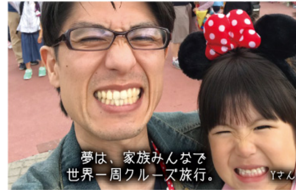
夢は、家族みんなで世界一周クルーズ旅行。