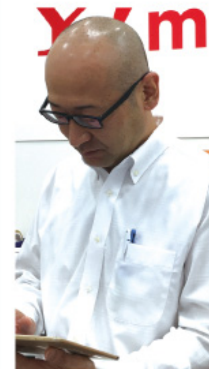
ヒダ株モバイル通信部 Tさん