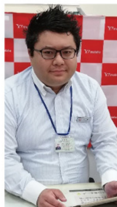
ヒダ株モバイル通信部 Tさん