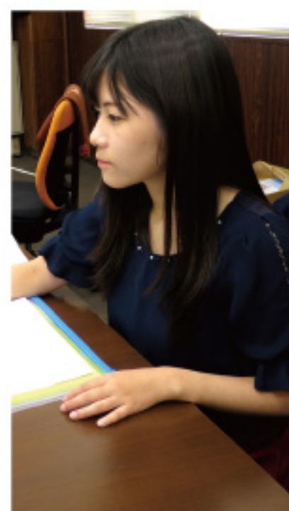
ヒダ株管理本部 Kさん