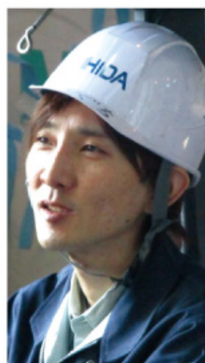
ヒダ物流株富士支社 Hさん