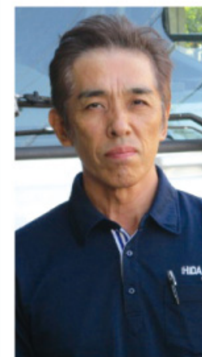
ヒダ物流株富士支社 Sさん